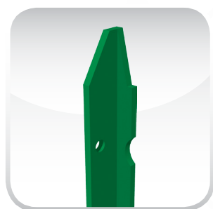
VERDE RAL 6005