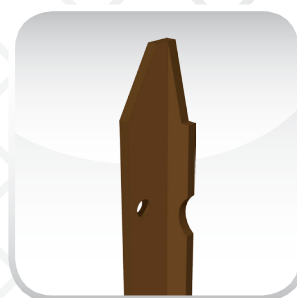
MARRONE SCURO RAL 8017