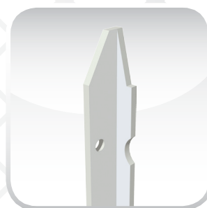
BIANCO AVORIO RAL 1013