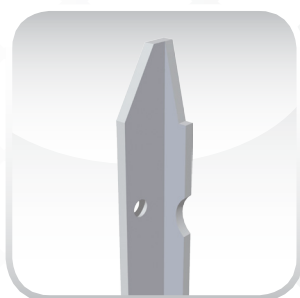
GRIGIO PERLA RAL 7045