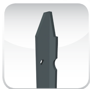
GRIGIO ANTRACITE RAL 7015